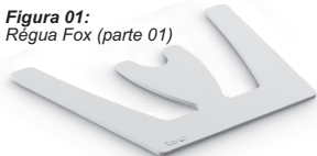
Figura 01: Régua Fox (parte 01)